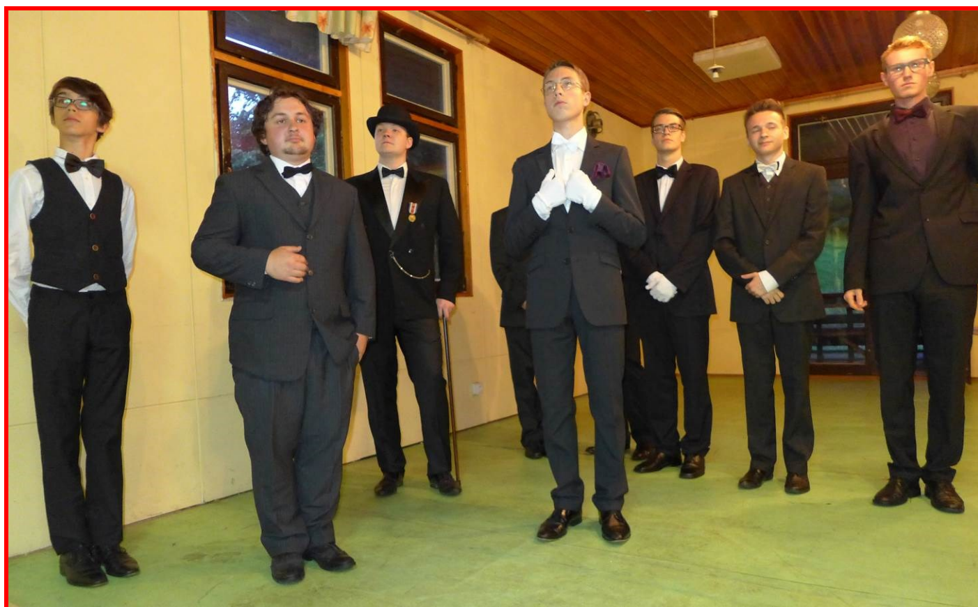
Organizační výbor přímého přenosu ve složení... ve složení.