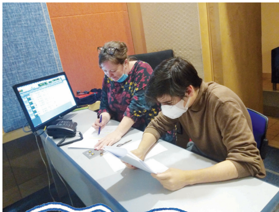
Při natáčení rozhlasové hry Ježípětr, 2020