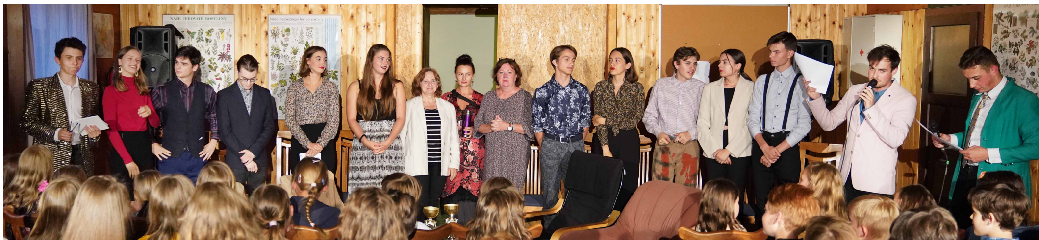
Zahájení letního soustředění DRDS, 2019