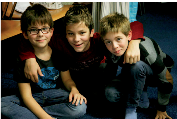
Ze zkoušek Přípravky a Vánoční zpěvy