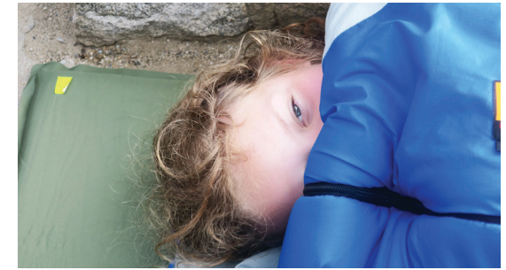
foto z přespání na hradě HaNo

Byla jednou jedna holčička a ta se jmenovala Amálka. A ta šla jednou vyhodit kapesník a tam bylo něco červeného, - nějaký tečky. A ty tečky se nějak pohybovaly. A najednou se ty tečky pohybovaly. A najednou ty tečky začaly skákat, takže ta holčička zjistila, že jsou to krvaví broučci. A ti tu holčičku zkousali do masa a pak až do kostí. A pak ti broučci odnesli tu holčičku (tu kostru) na silnici a tam přišla maminka... a ti broučci jí taky snědli.