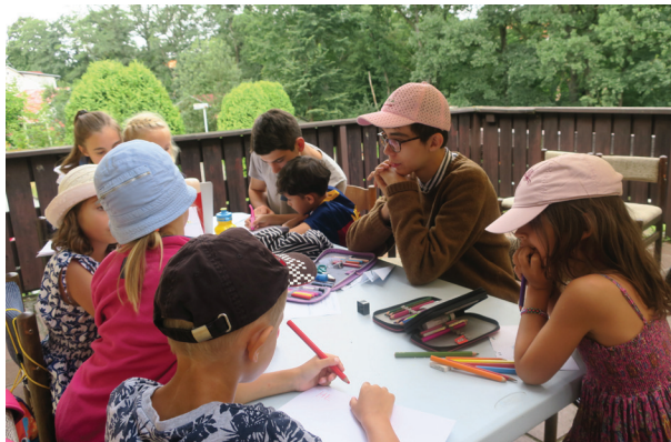
foto z přespání na hradě