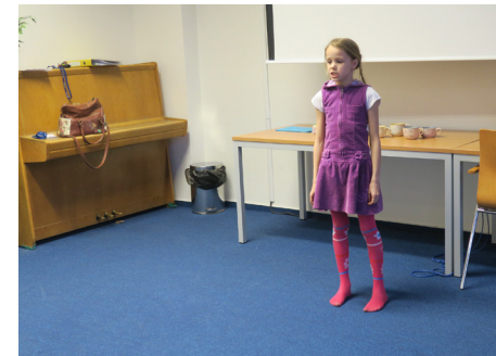
Souborové kolo Pražského poetického setkání 23. 2. 2017